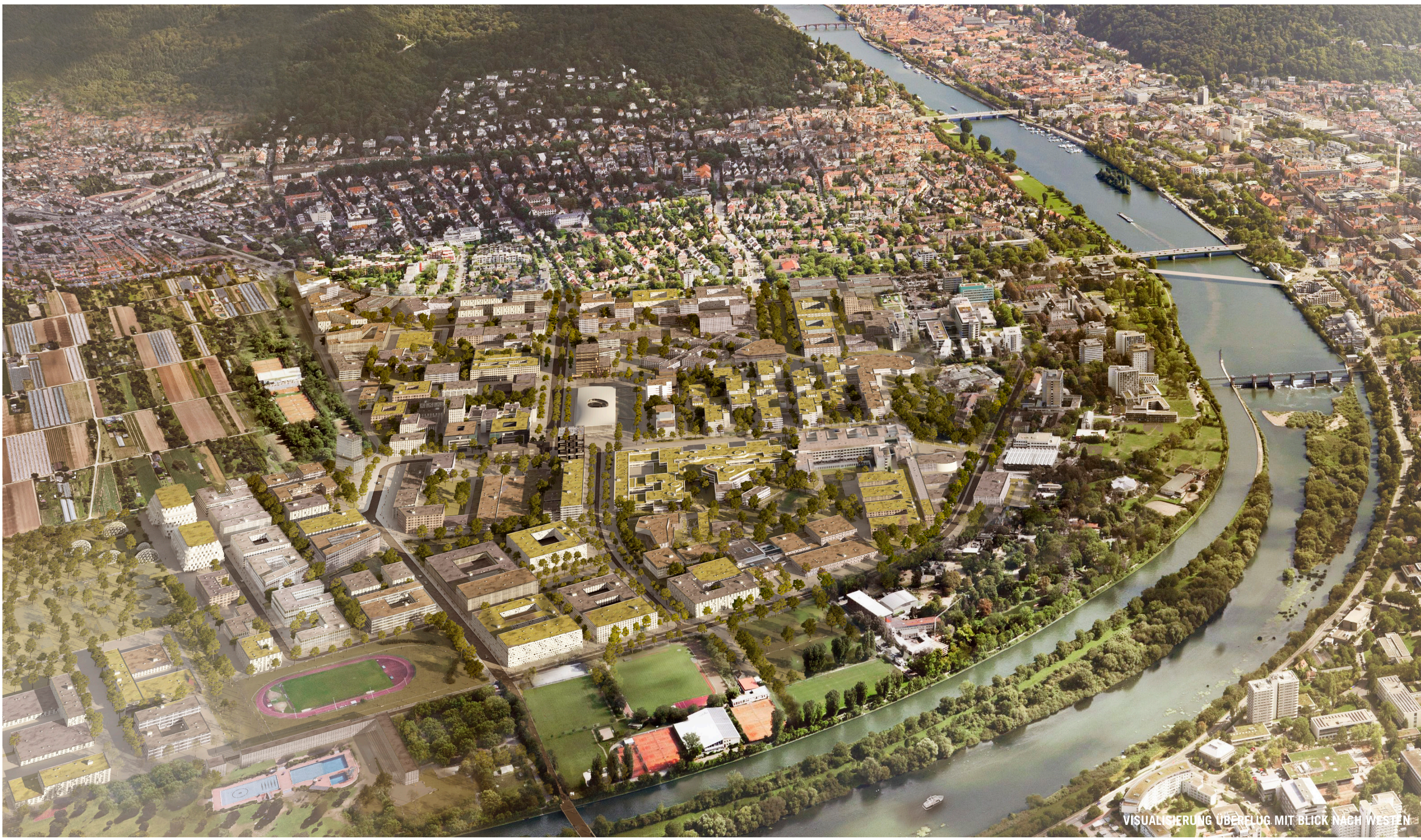
VISUALISIERUNG ÜBERBLICK MIT BECK NACH WESTEN