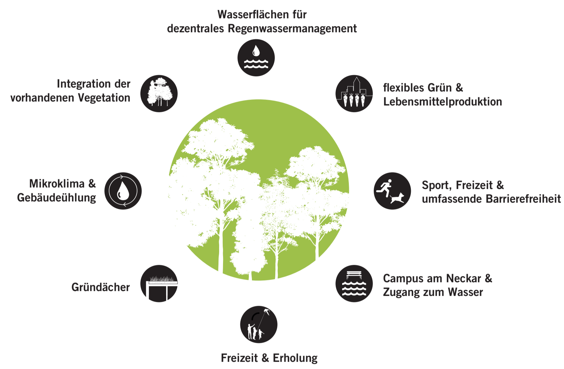
STRATEGIE & BAUSTEINE FREI-/GRÜNRAUM