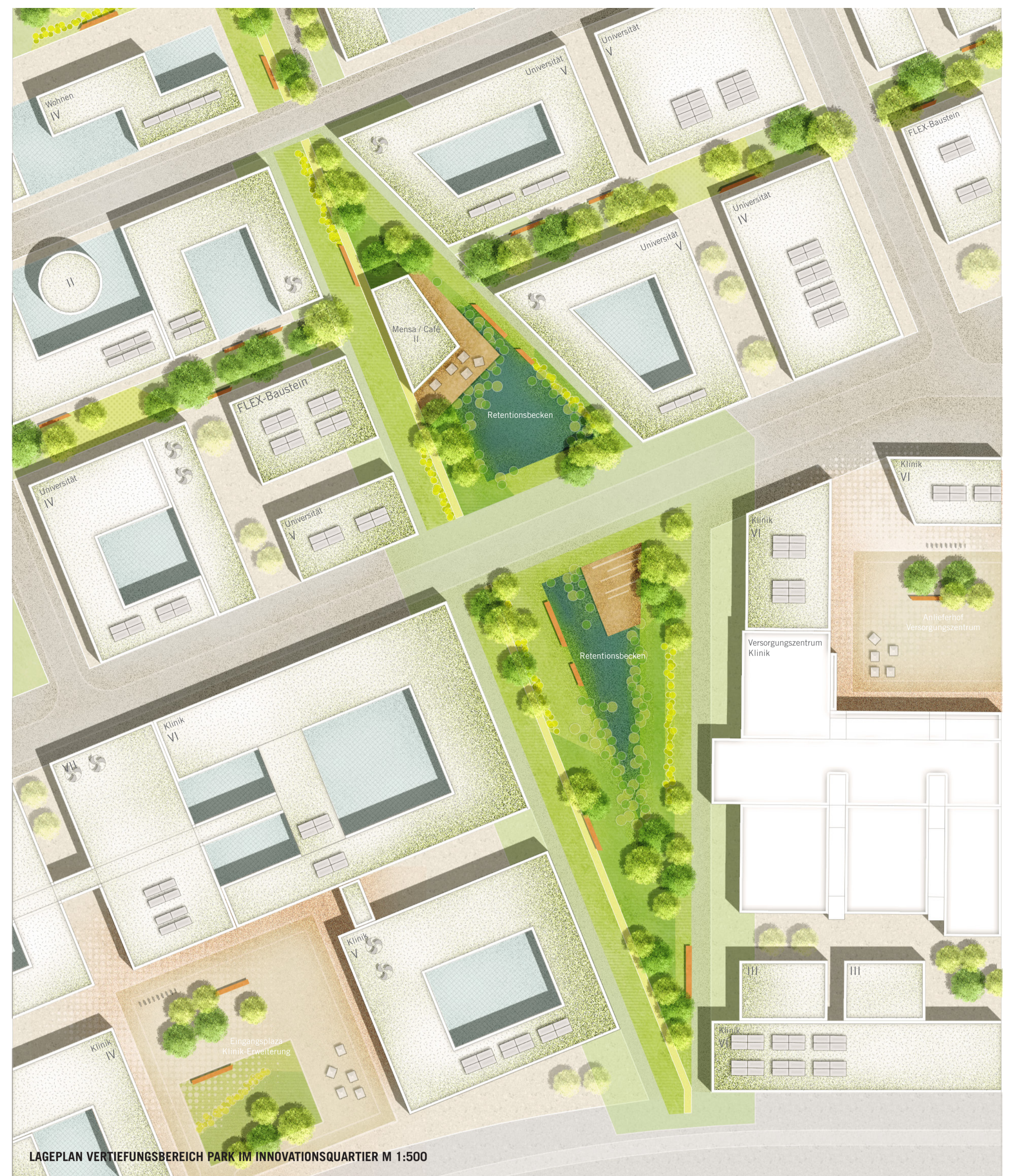
LAGEPLAN VERTIEFUNGSBEREICH PARK IM INNOVATIONSQARTIER M 1:500