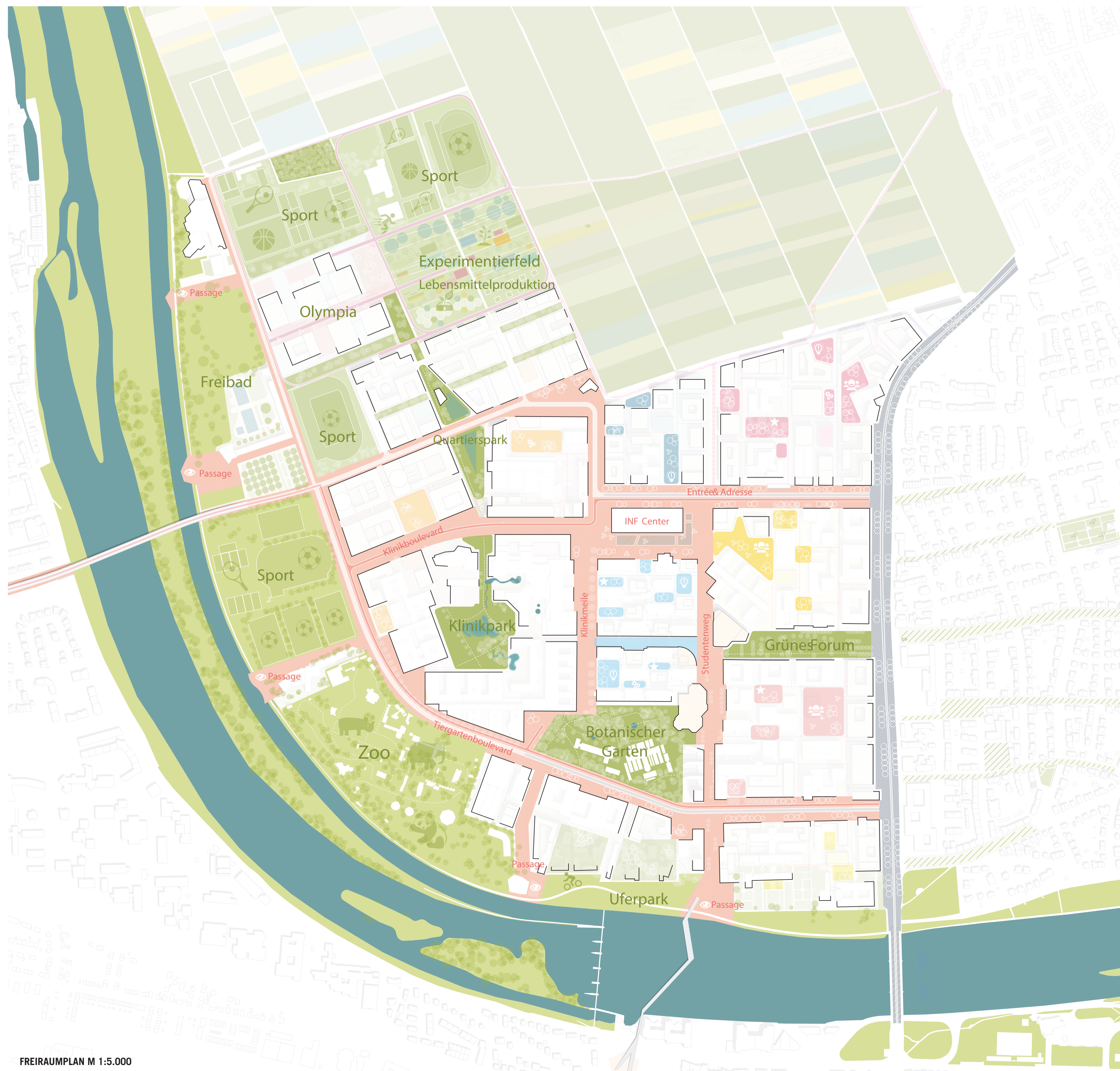
FREIRAUMPLAN M 1:5.000