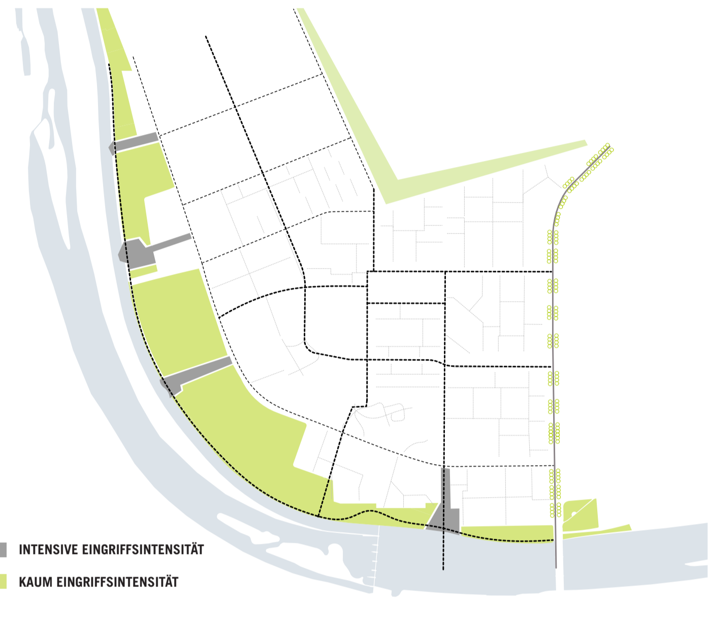
EINGRIFFSINTENSITÄT: PASSAGEN / GRÜNVERBINDUNGEN