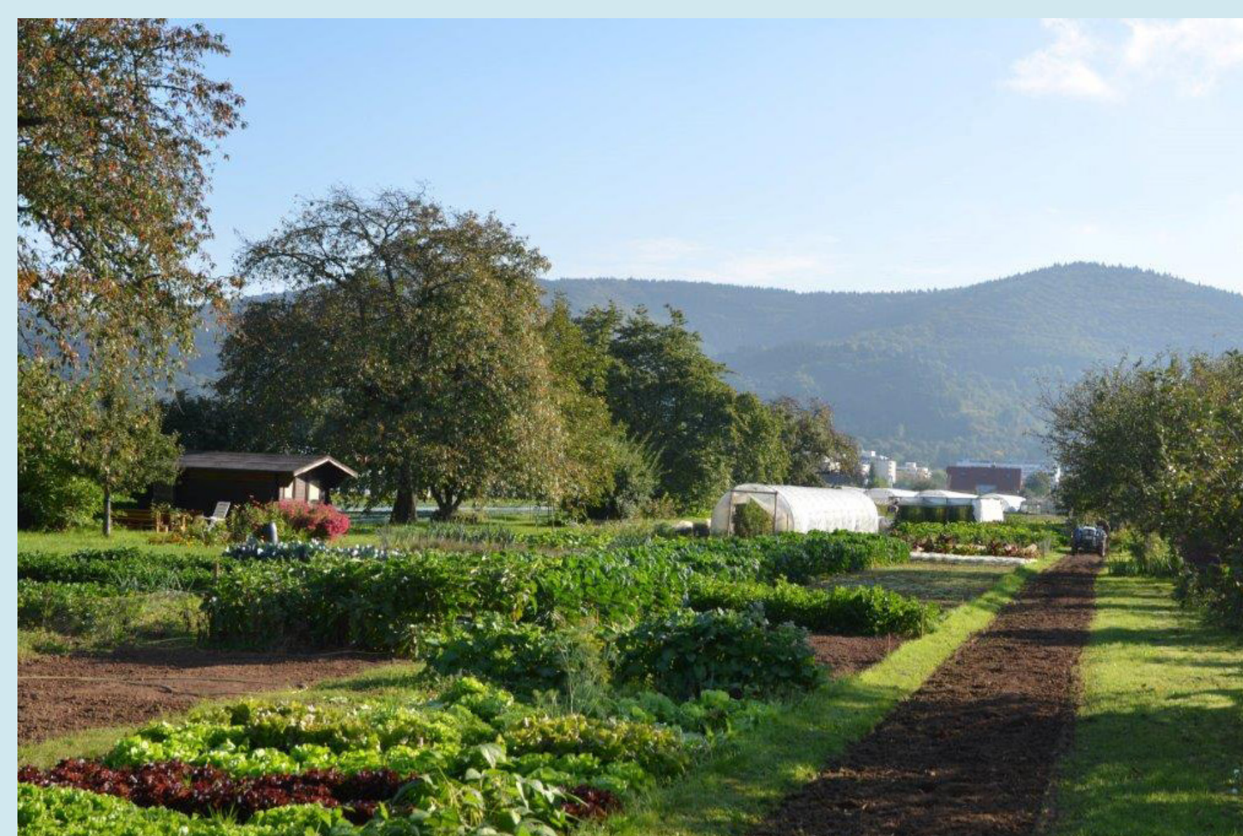
Handschuhsheimer Feld: Vielfalt - Kulturland