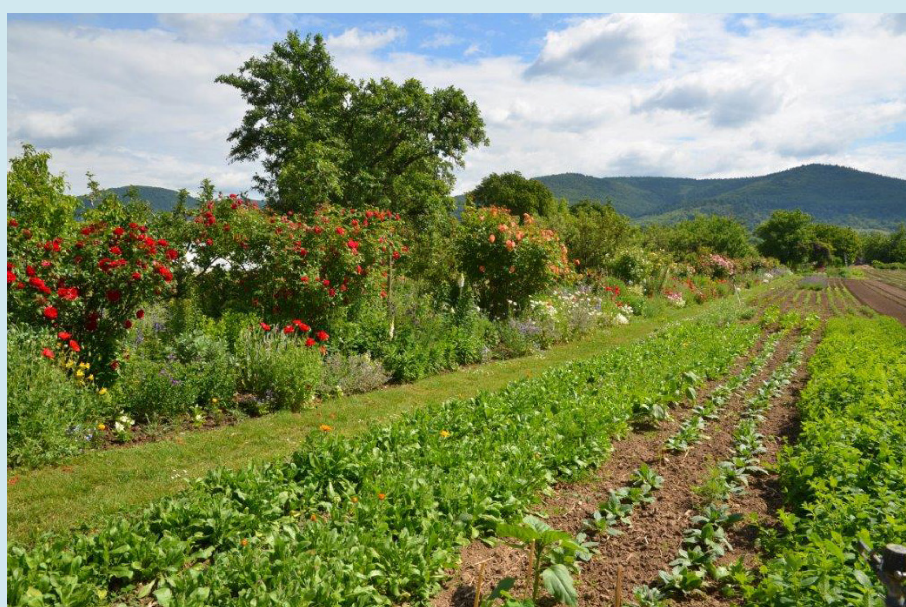
Handschuhsheimer Feld: Nahversorgung - Lebensräume

Die Wechselbeziehungen zu den angrenzenden Stadtteilen haben von gegenseitigem Verständnis und Respekt geprägt zu sein.